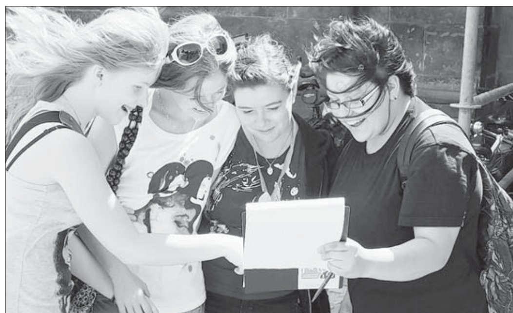
Schülerinnen des Hegelgymnasiums auf der Suche nach „Schätzen“, die in der Stadt versteckt sind. Beim Geocaching müssen die Teilnehmer Rätsel lösen, um diese zu finden.

Parallel dazu wird die Ausstellung „Die Europa-Passage“ mit den Ergebnissen der vorangegangenen Projektwoche gezeigt. Außerdem gibt es reichlich Angebote zur Unterhaltung und auch für das leibliche Wohl wird gesorgt sein.