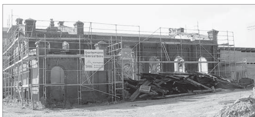
Die Alte Schmiede an der Rogätzer Straße wird derzeit saniert.

„Das Dach konnte nicht mehr gerettet werden, da es