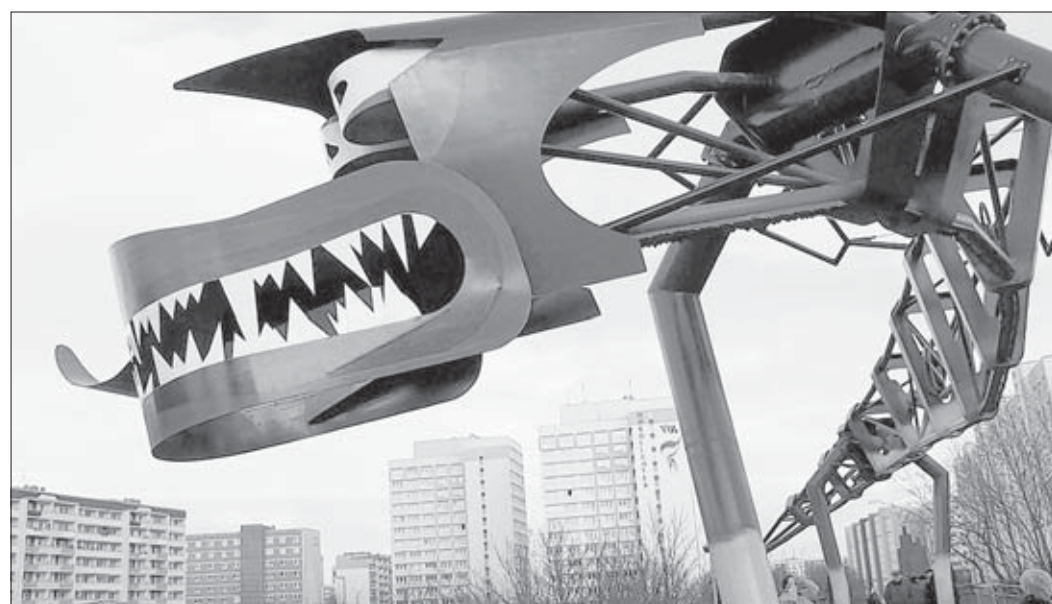
Die Lindwurmbrücke führt über den Magdeburger Ring und soll im Norden die Stadtteile Kannenstieg und Neustädter See verbinden. Die Auffahrten sollen deshalb barrierefrei gestaltet werden.

Das würde den Kostenrahmen jedoch sprengen. Im Haushaltsplan der Landeshauptstadt sind für das Brückensanierungsprojekt 60 000 Euro eingeplant, wovon zwei Drittel über das Förderprogramm „Soziale Stadt“ von Land und Bund als Zuschuss kommen sollen. Nach Auffassung von Experten würden neue, flachere Rampen etwa das Drei- bis Vierfache kosten. Als „nicht hinnehmbar“ sah