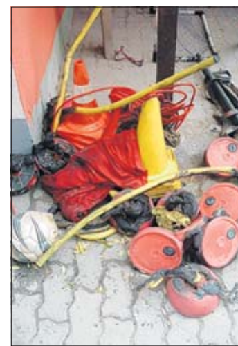
Verkohlte Hütchen, Stangen und Bälle nach dem Brand.